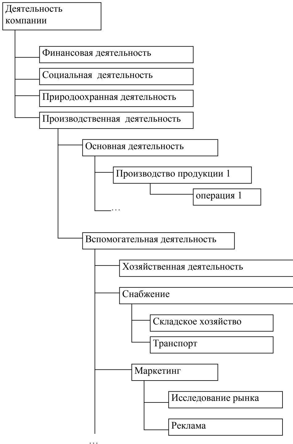
Рис. 1.1. Функциональная структура организации

Приведите структуру деятельности организации в виде иерархии подсистем. На рис. 1 приведен пример функциональной структуры организации.