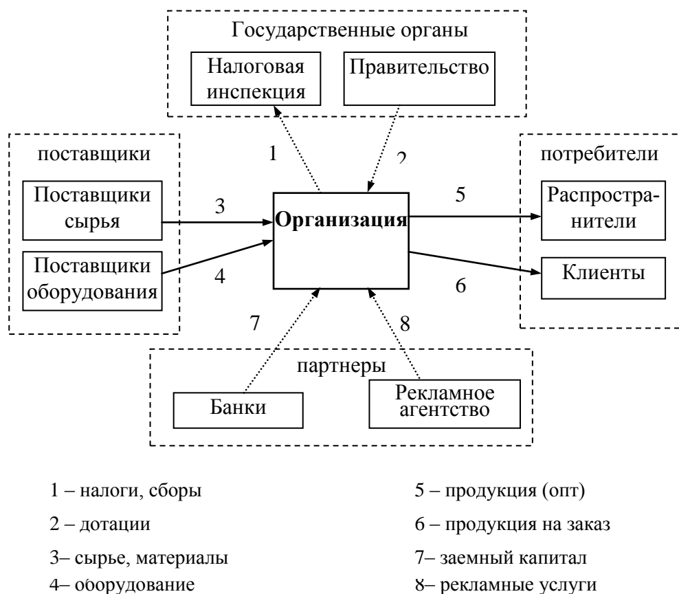
Рис. 3.1. Взаимодействие предприятия с окружающей средой

Приведите схему взаимодействия организации с системами окружающей среды и опишите взаимосвязи. Пример схемы приведен на рис. 3.1.